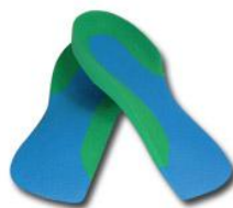
Ορθωτικά για καλό παπούτσι αντρών