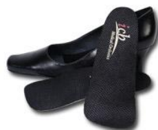
Ορθωτικά για γόβες