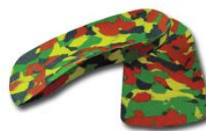
Ορθωτικά για παιδιά