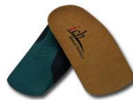
Ορθωτικά για μεγαλόσωμους